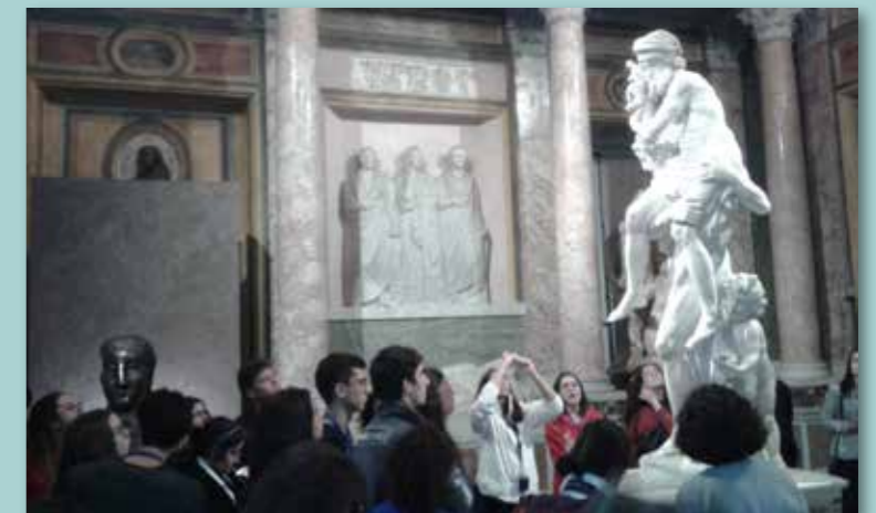
Roma, 28 ottobre 2018 Il presidente dell'Associazione Rotta di Enea con gli studenti del Liceo St. Joseph di Smirne in visita alla Galleria Borghese di Roma.