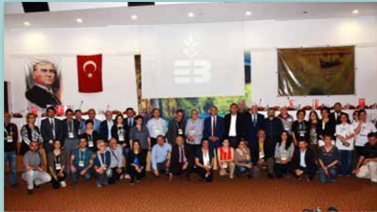
Edremit, 4-7 maggio 2017 Meeting Itinerario Culturale Rotta di Enea

L'Associazione Rotta di Enea è stata costituita l'11 gennaio 2018. Ha sede legale in Roma e potrà aprire propri uffici, delegazioni o rappresentanze in Italia ed all'estero.